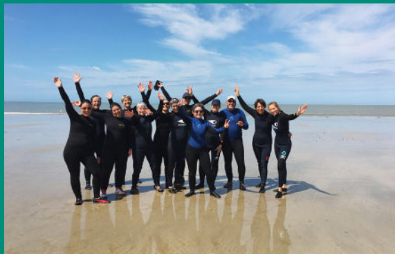
Impression ICI - Crédit photos : Cécile Nouchet, Octobre 2022.

N'hésitez pas à venir nous rencontrer. La Cité des soins est ouverte à toutes et tous.